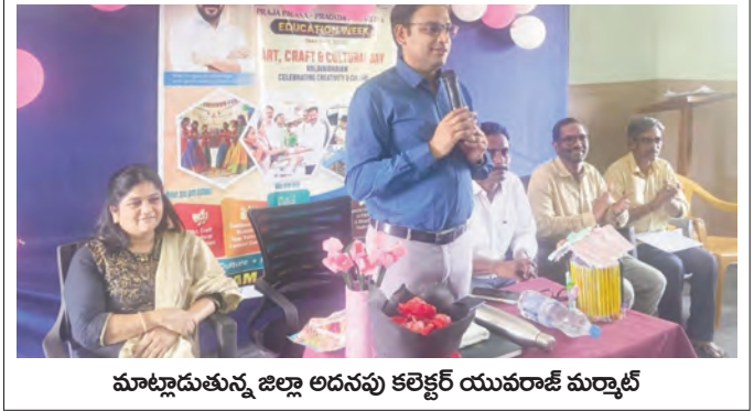
మాట్లాడుతున్న జిల్లా అదనపు కలెక్టర్ యువరాజ్ మర్తాజ్

ప్రభుత్వం విద్యారంగ అభివృద్ధికి ప్రత్యేక చర్యలు తీసుకుంటుందని జిల్లా అదనపు కలెక్టర్ యువరాజ్ మర్తాజ్ అన్నారు. ప్రజా పాలన ప్రగతి ప్రణాళిక 99 రోజుల కార్యచరణలో చేపట్టిన విద్యా వాలోత్సవాలలో భాగంగా జిల్లా కేంద్రంలోని జిల్లా పరిషత్ బాలికల ఉన్నత పాఠశాలలో ఏర్పాటు చేసిన ఖగళా నైపుణ్య, సాంస్కృతిక దినోత్సవంగా (కళాయవనిక) కార్యక్రమానికి అధికారులతో కలిసి హాజరయ్యారు. ఈ సందర్భంగా జిల్లా అదనపు కలెక్టర్ మాట్లాడుతూ ప్రభుత్వ విద్యా సంస్థలను అభివృద్ధి చేస్తూ విద్యార్థులకు అవసరమైన సదుపాయాలు కల్పించి నాణ్యమైన విద్య అందించే దిశగా కృషి చేస్తుందని తెలిపారు. అన్ని ప్రభుత్వ పాఠశాలలలో అభివృద్ధి పనులు చేపట్టి సకల సదుపాయాలతో పాడిన నాణ్యమైన విద్య అందించే దిశగా చర్యలు చేపడుతుందని తెలిపారు. ప్రతి ఒక్కరి జీవితంలో విద్యతో పాటు నైపుణ్యాలు, భాషా పరిజ్ఞానం, క్రీడలు వ్యక్తిగత విజయానికి పునాదులని తెలిపారు. విద్యార్థులు చదువుతో పాటు సృజనాత్మక రంగాలలో రాణించాలని, సామాజిక సేవ బాధ్యతగా తీసుకోవాలని తెలిపారు. ప్రభుత్వ పాఠశాలల్లో సాకార్యలు కల్పిస్తూ నిష్ణాతులైన ఉపాధ్యాయుల ద్వారా చేస్తున్న విద్యా బోధనతో ప్రభుత్వ పాఠశాలలలో ఫలితాలు అద్భుతంగా వస్తున్నాయని, ప్రైవేట్ పాఠశాలల నుండి ప్రభుత్వ పాఠశాలల వైపు విద్యార్థులు ఆడుగులు వేస్తున్నారని తెలిపారు. ఈ సందర్భంగా విద్యార్థులు ప్రదర్శించిన వివిధ రకాల హస్తకళలు, చిత్రలేఖనాలు, సాంస్కృతిక ప్రదర్శనలను అందరినీ అలరించాయి. ఈ కార్యక్రమంలో విద్యాశాఖ అధికారులు, పాఠశాల ఉపాధ్యాయులు, విద్యార్థులు పాల్గొన్నారు.