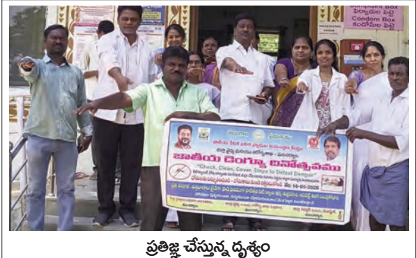
ప్రతిజ్ఞ చేస్తున్న దృశ్యం