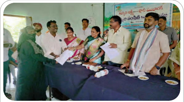
లబ్ధిదారులకు చెక్కులు పంపిణీ చేస్తున్న ప్రజా ప్రతినిధులు