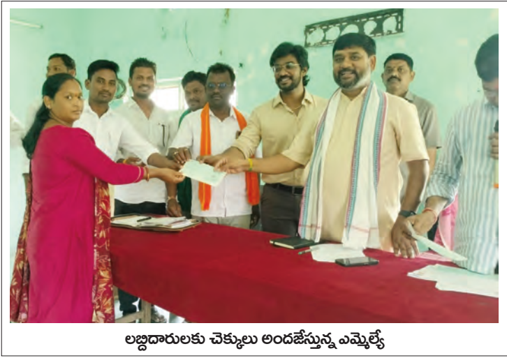
లబ్ధిదారులకు చెక్కులు అందజేస్తున్న ఎమ్మెల్యే

కాగజ్ నగర్ మండలంలో నెలకొన్న లో వోల్టేజీ సమస్యలను శాశ్వతంగా పరిష్కరించేందుకు ప్రభుత్వం కొత్తగా మూడు 33/11 కేవీ విద్యుత్ సబ్ స్టేషన్లు మంజూరు చేసినట్లు సిర్పూర్ శాసనసభ్యులు డా. పాలవాయి హరీష్ బాబు తెలిపారు. శనివారం పట్టణంలోని మండల ప్రజా పరిషత్ కార్యాలయంలో నిర్వహించిన కార్యణలక్ష్మి, షాద్ ముబారక్ చెక్కుల పంపిణీ కార్యక్రమంలో పాల్గొన్న ఎమ్మెల్యే, 31 మంది లబ్ధిదారులకు చెక్కులను అందజేశారు. ఈ సందర్భంగా ఏర్పాటు చేసిన సమావేశంలో ఆయన మాట్లాడుతూ కాగజ్ నగర్ మండల ప్రజలు చాలా కాలంగా ఎదుర్కొంటున్న విద్యుత్ లో వోల్టేజీ సమస్యలను దృష్టిలో ఉంచుకొని ప్రభుత్వం మూడు నూతన విద్యుత్ సబ్ స్టేషన్ల నిర్మాణానికి ఆమోదం తెలిపిందన్నారు. మండలంలోని అంకుసాపూర్, బోడేపల్లి గ్రామాలతో పాటు కాగజ్ నగర్ పట్టణంలోని కాపువాడ ప్రాంతంలో కొత్త 33/11 కేవీ విద్యుత్ సబ్ స్టేషన్లు నిర్మించనున్నట్లు తెలిపారు. ఈ సబ్ స్టేషన్లు పూర్తయిన అనంతరం గ్రామాలు, పట్టణ ప్రాంతాల్లో విద్యుత్ సరఫరా మెరుగుపడటంతో పాటు రైతులు, గృహ వినియోగదారులు, చిన్న వ్యాపారులకు ఎంతో ప్రయోజనం కలుగుతుందని పేర్కొన్నారు. అలాగే ప్రభుత్వం తరఫాననే రెండో విడత ఇందిరమ్మ ఇండ్ల మంజూరు ప్రక్రియను చేపట్టనున్నట్లు ఎమ్మెల్యే వెల్లడించారు. ఇప్పటివరకు ఇందిరమ్మ ఇండ్లకు దరఖాస్తు చేసుకోని అర్హులైన లబ్ధిదారులు తమ గ్రామాలు ఎంపీడీవో కార్యాలయాల్లో దరఖాస్తులు సమర్పించాలని సూచించారు. ఈ కార్యక్రమంలో తహసీల్దార్ మల్లపూల మధుకర్, ఎంపీడీవో సిహెచ్ ఉజ్వల్ కుమార్, సర్పంచులు బిహెచ్ గారమి, వేణు యాదవ్, అగ్గిళ్ల సంగీతశ్రీనివాస్, రాజేందర్ జాదవ్, నాయకులు పుల్ల ఆశోక్, పిర్నింగుల తిరుపతి, లోనారే రవీందర్, కొప్పుల సుధాకర్, దోతుల శ్రీనివాస్ తదితరులు పాల్గొన్నారు.