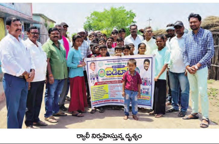
కాలీ నిర్వహిస్తున్న దృశ్యం