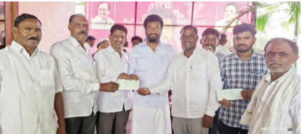
అసిఫాబాద్ టౌన్, మే 16, ప్రభాతవార్త: